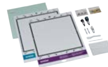
Accessori in dotazione

Adatta per tappetini 12 x 12" (30,5 x 30,5 cm) e 12 x 24" (30,5 x 61 cm)